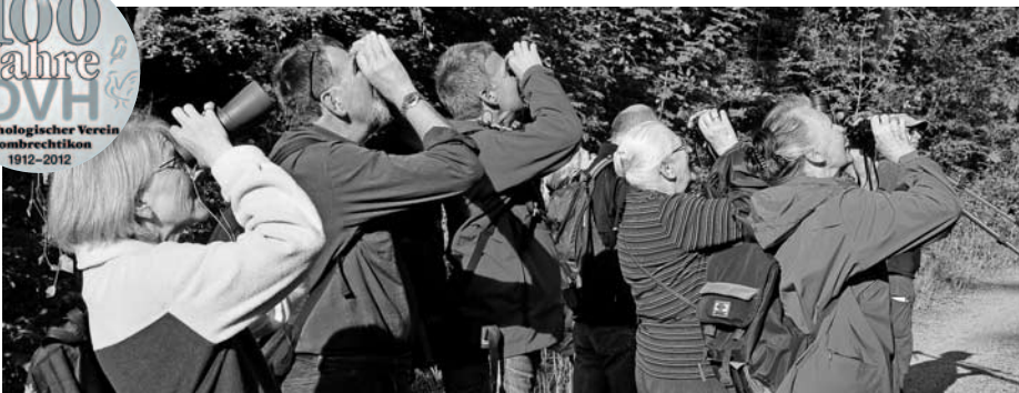
Weitblick – für unsere nachfolgenden Generationen!