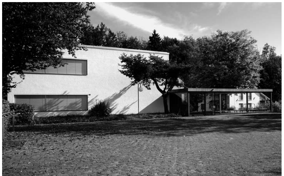
Schulhaus Tobel 1 mit Pausenplatz

Wie bereits erwähnt, wird der Projektierungskredit von 3.2 Millionen Franken der Gemeindeversammlung vom 12. Dezember dieses Jahres vorgelegt. Bei Zustimmung kann mit dem Bewilligungsverfahren im ersten Quartal 2013 (Februar bis April) begonnen werden. Ausführungsplanung, Bausubmissionen und Vergaben etc. sollten im September 2013 abgeschlossen sein, sodass – im normalen Fall – im Herbst 2013 mit den Bauarbeiten begonnen werden kann. Fertigstellung und Bezug sind dann für Ende 2014 vorgesehen.