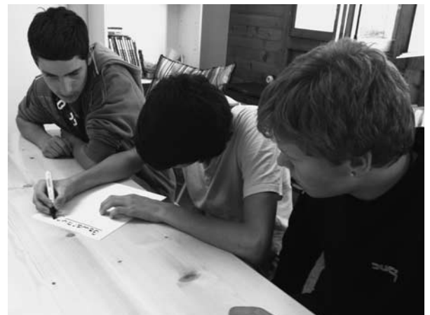
Arbeiten an den eigenen Kompetenzen