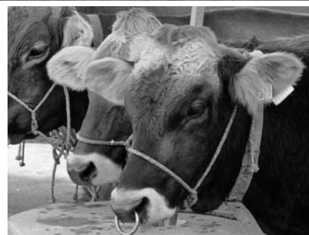
Weitere Bilder finden Sie unter www.hombrechtikon.ch/Portrait/Galerie/Anlässe