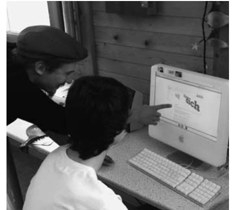
Zusammenspiel verschiedener Akteure