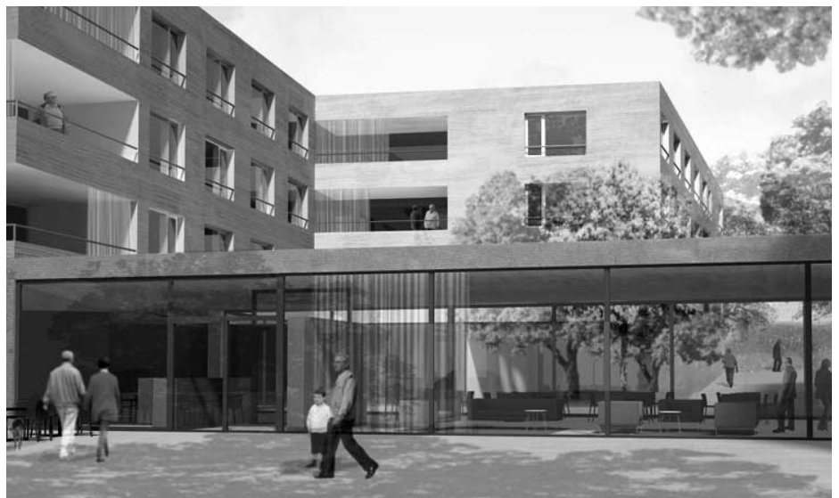
Visualisierung des Siegerprojekts