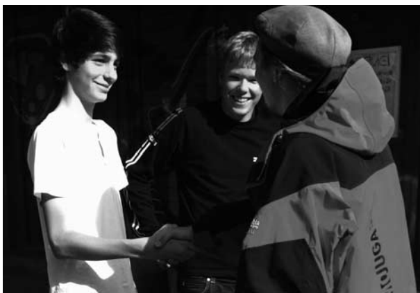
Hand in Hand – Begleitung ist wichtig!

Um auch dieser Zielgruppe eine Chance zu geben, den Einstieg ins Berufsleben zu schaffen, beteiligt sich die Schule seit dem Schuljahr 2011/12 mit zwei Klassenzügen am Jugendprojekt LIFT. Das Ziel ist, die Chancen von Jugendlichen mit schwachen Schulleistungen nach der obligatorischen Schulzeit zu verbessern, um eine bessere Berufsintegration zu ermöglichen.