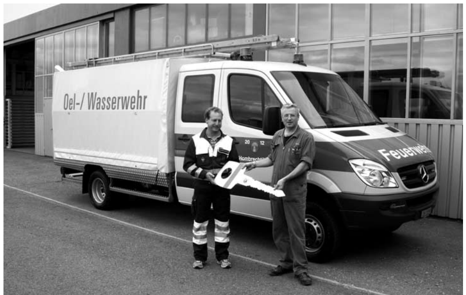
Neues Öl/Wasserwehrfahrzeug – Schlüsselübergabe