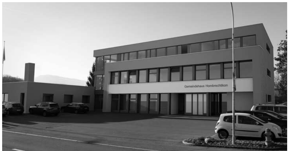
Perspektive «Umbau Gemeindehaus»