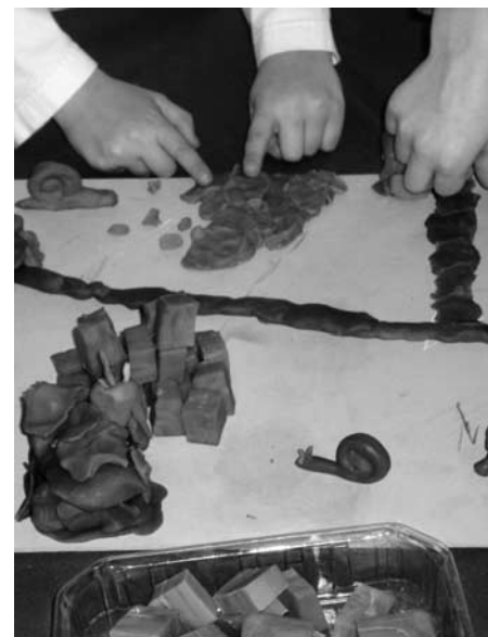
Spannender Entstehungsprozess

So wurde auf verschiedenste, alle Sinne ansprechende Art zum Thema geforscht, experimentiert, gebastelt und kreativ gestaltet. Schülerinnen und Schüler sowie Kindergärtner genossen das bunte Treiben und die musische Abwechslung vom Schullalltag in vollen Zügen.