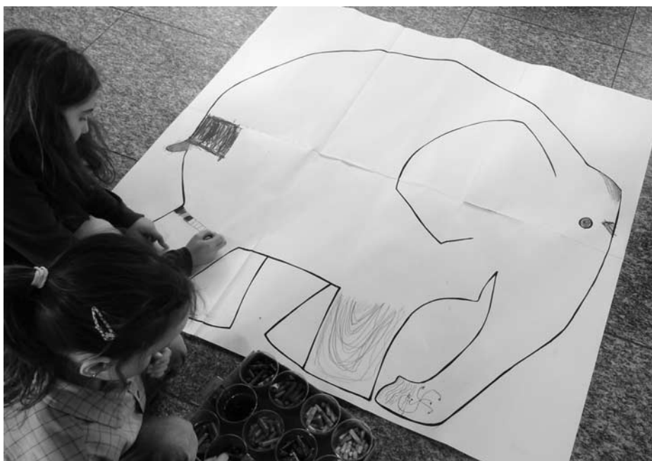
Elmar wird gemeinsam «bunt eingekleidet»

Es wurden aber auch selber Farben hergestellt, Versuche mit Lebensmittelfarben durchgeführt oder mit buntem Teig gebakken. Einige Kinder durften aus Abfallmaterial ein Kaleidoskop, andere einen Farbkreislauf oder Collagen basteln. Farbgeschichten wurden zudem musikalisch erzählt und dabei Farben in Bewegungen umgesetzt; in einem Atelier fand gar ein veritables Farbenfest statt.