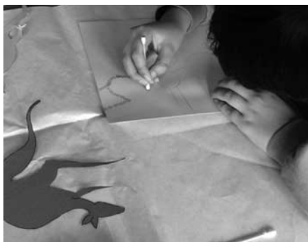
Künstler bei der Arbeit

Die Projektnachmittage standen ganz im Zeichen der Farbe, unter dem Oberthema «Farbgeschichten» boten die Lehrpersonen die mannigfaltigsten Kurse mit unterschiedlichen Schwerpunkten an.