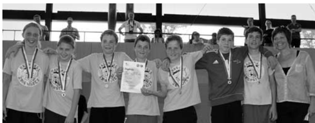
Die «Handball Z(H)ombies» erreichten Gold!

An den 17. Schweizer Meisterschaften im Schulhandball (4. bis 7. Schuljahr) am 15. Juni in Thun sicherten sich die vier Teams aus Hombrechtikon eine Gold- und zwei Bronzemedailen.