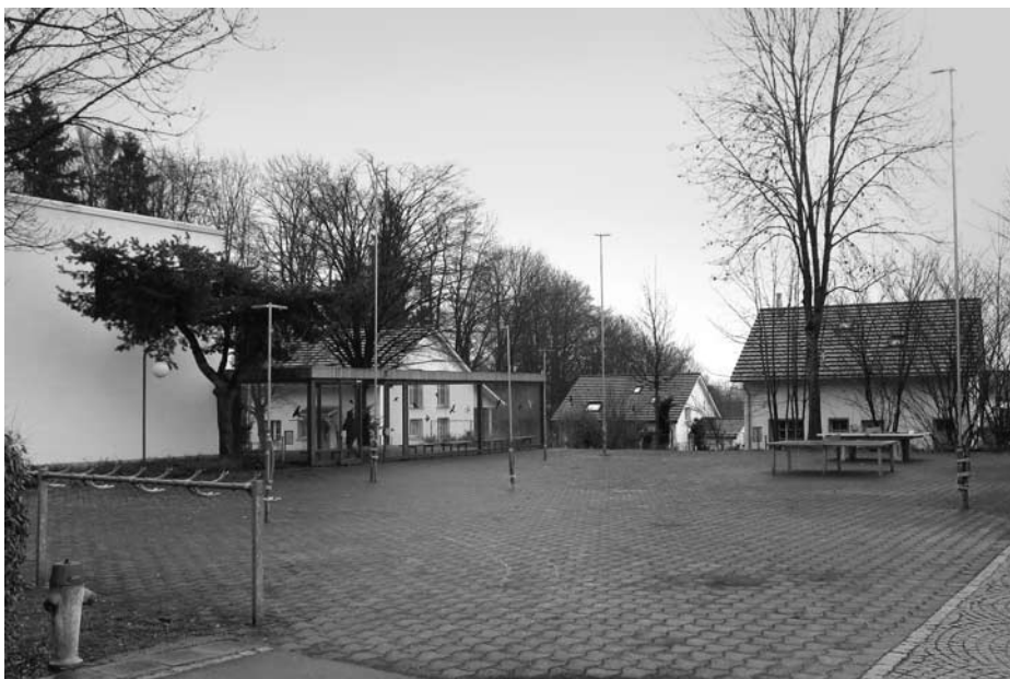
Baugespann für das neue Gebäude