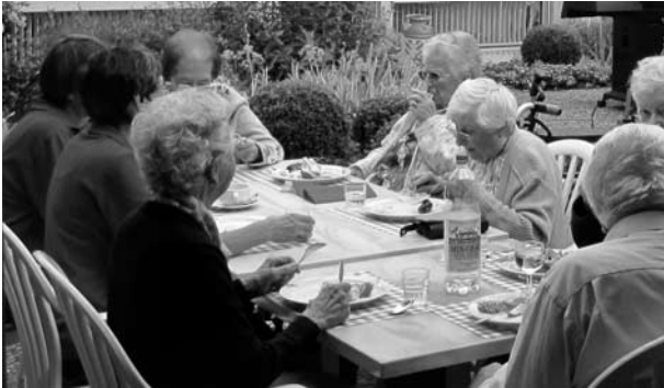
Mittagessen im «Breitlen»

Gemeinsam mit dem Betreuungszug des Zivilschutzes organisierten die Mitarbeitenden des Alters- und Pflegeheims Breitlen für die Bewohnerinnen und Bewohner des Heims sowie der Alterssiedlung am 5. Juli einen Erlebnistag, an dem das Thema «Käse» im Zentrum stand.