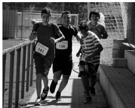
Schüler auf der Laufstrecke