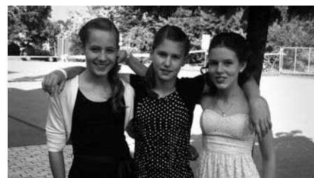
Elegant und gut gelaunt zur Party.

Nach der Eingangskontrolle und dem obligaten Gang über den roten Teppich gab es zur Begrüssung für alle ein erfrischendes Glas Bowle. Kurz darauf eröffneten die beiden «Tätschmeisterinnen» die Party offiziell und sie gaben die Tanzfläche frei. Jetzt wurde ausgiebig getanzt, gelacht und gefeiert. Die jungen Partygänger hatten zudem die Möglichkeit, sich in ihrer Abendgarderobe von einem Profi-Fotografen ab-