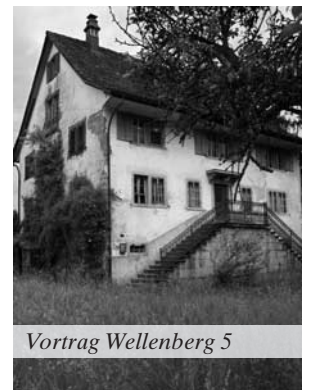
Vortrag Wellenberg 5