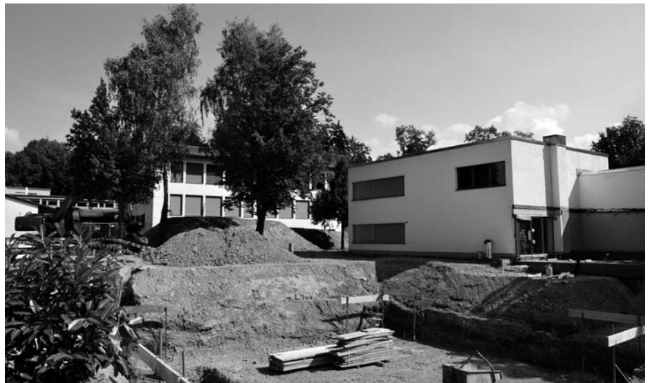
Aushub für den Neubau