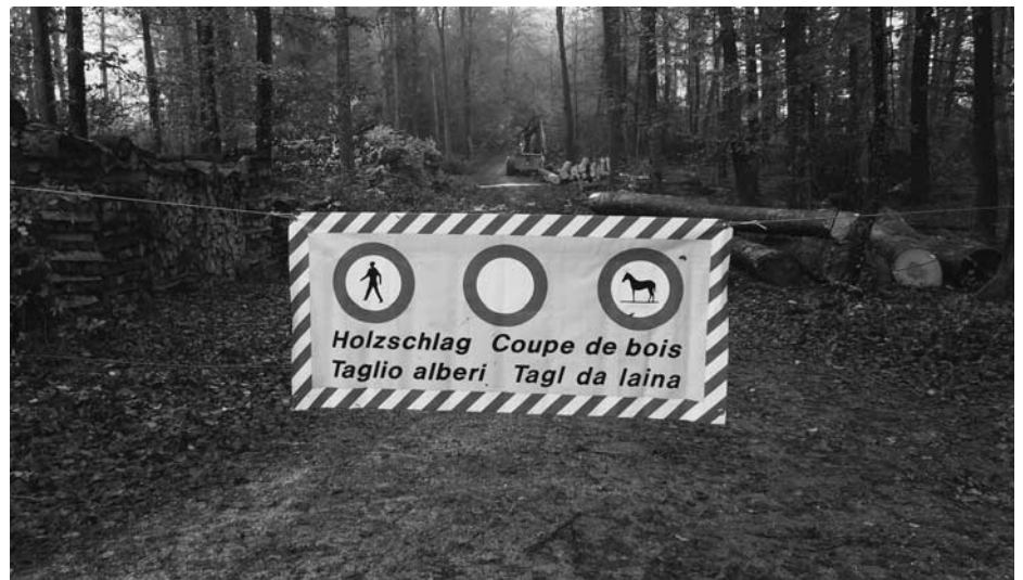
Sicherheitsabspernung beim Holzschlag