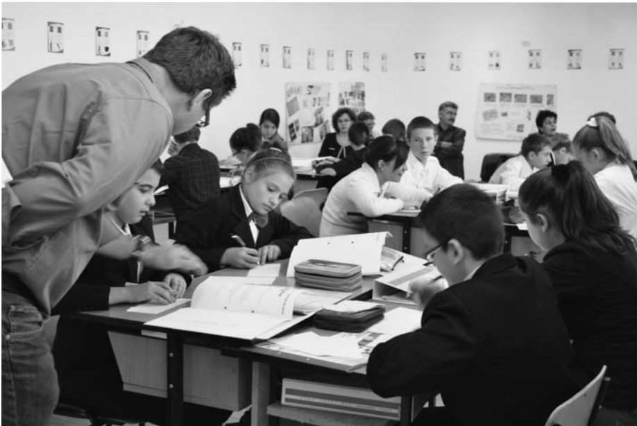
Modellktion zu schüleraktivierendem Unterricht

Das Kernstück des Unterrichts ist die Erkundung von Betrieben. Dabei wenden die Jugendlichen die erworbenen Kompetenzen an. Zum Beispiel führen sie mit verschiedenen Leuten im Betrieb Interviews und werten diese aus. Abgeschlossen wird das Schuljahr mit einer Ausstellung zu den Kenntnissen in den erkundeten Berufsfeldern. Schülerinnen und Schüler gestalten