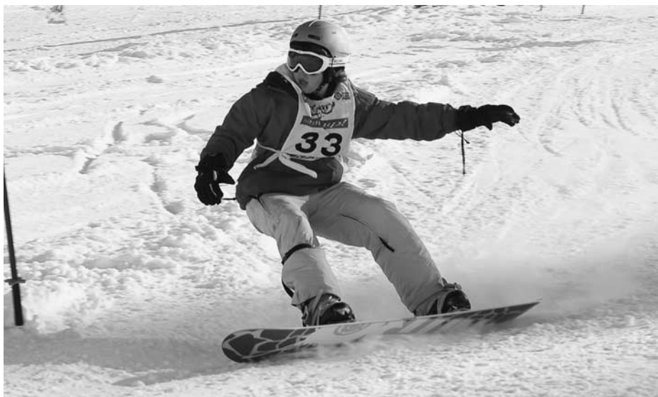
In voller Fahrt

Vor rund vierzig Jahren entstand die Idee, für Kinder und Erwachsene aus Hombrechtikon einen Sportanlass in Form eines Skirennens durchzuführen. Um die dafür notwendigen finanziellen Mittel aufzubringen, wurde die Winterbörse ins Leben gerufen. In der Zwischenzeit hat sich diese zur grössten und beliebtesten Börse in der Region entwickelt. Durch das Aufkommen von Snowboards hat sich zudem das Skifest um eine Disziplin erweitert.