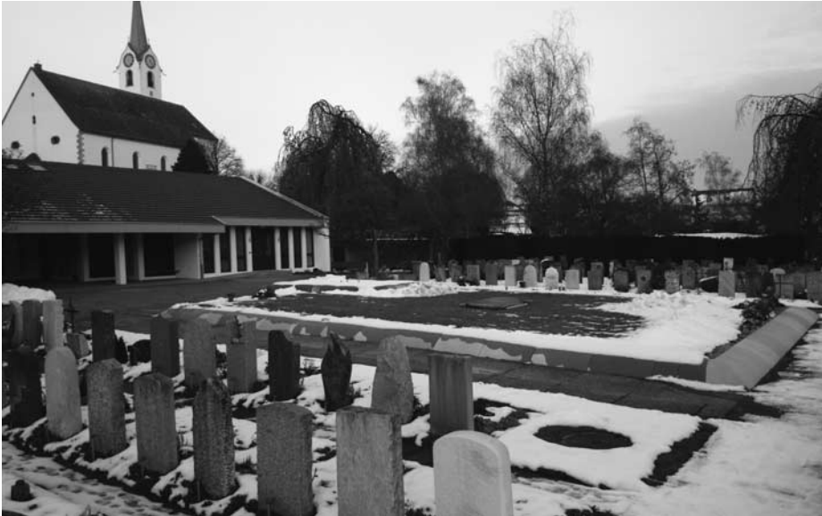
Neu gestaltete Friedhofanlage

In den letzten Monaten wurden diverse Änderungen an der Friedhofanlage vorgenommen. So wurden in einer ersten Phase die Aufbahrungsräume umgebaut und das Gemeinschaftsgrab neu gestaltet.